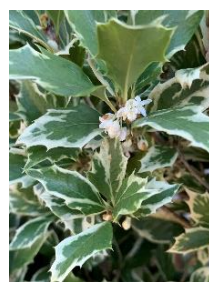
⑭ヒイラギ(斑入り) モクセイの仲間、花に芳香がある。