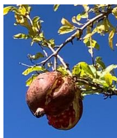
⑫ザクロ 西南アジア、中東原産で、最も古くから栽培された果樹の一つ。