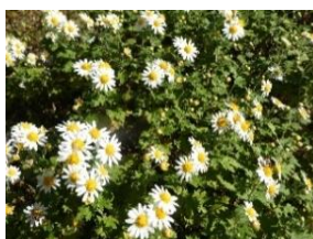
⑯ノジギク 兵庫県の県花。瀬戸内海に近いエリアに自生するが、変異が多い。