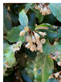
⑮ナワシログミ 垣根などに使われる常緑低木。花には甘い香りがある。