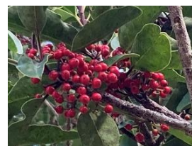
⑩クロガネモチ 日本の中部以南～インドシナまで分布。