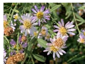
⑲ノコンギク (淡路産) 田畑の畔に多い野菊。