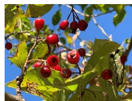
⑤カマツカ 木質が堅いため鎌をはじめ農具の柄に使われた。