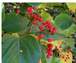
⑥ハクサンボク ガマズミ属の常緑小高木。西日本に多い。