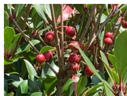
③モッコク 常緑中木。庭木によく使われる。