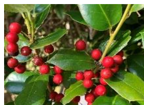
⑨ヒイラギモチ クリスマス飾りによく使われる。中国原産。