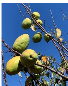
⑪カリン 香りのよい実は生食はできないが果実酒などに最適。