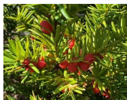
⑧キャラボク イチイの変種。雌雄異株なので雌株にしか実はつかない。