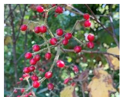
④ガマズミ 全国に分布する落葉低木。実は食べられる。