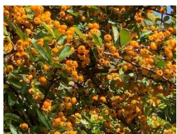
②ピラカンサ トキワサンザシ、タチバナモドキなどを総称してピラカンサという。赤、橙、黄などの実が美しい。