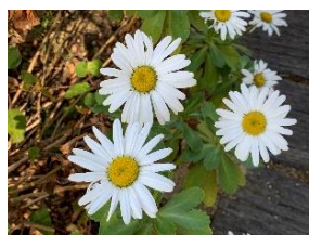
⑱ハマギク 青森から茨城の太平洋側海岸付近に自生する。日本の固有種。