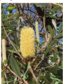
⑬コーストバンクシア オーストラリア固有種の樹木。乾燥に強い。