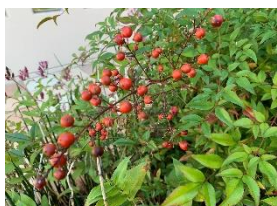
⑦ナンテン 難を転じるという縁起物で、庭木によく植えられる。