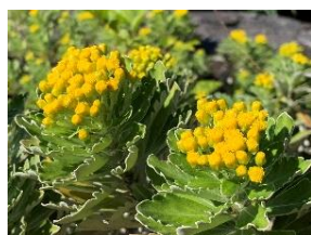
⑰イソギク 千葉～静岡の太平洋側海岸に自生。日本固有種。黄色の筒状花のみ。舌状花のあるものをハナイソギクという。